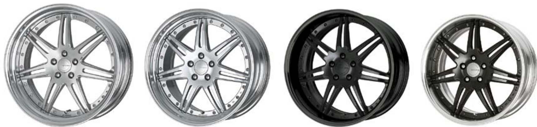
ブラッシュド (BRU) 21 (STEP RIM)

※カスタムオーダープラン対応アイコンの詳細は 各ブランドの最終ページをご確認下さい。