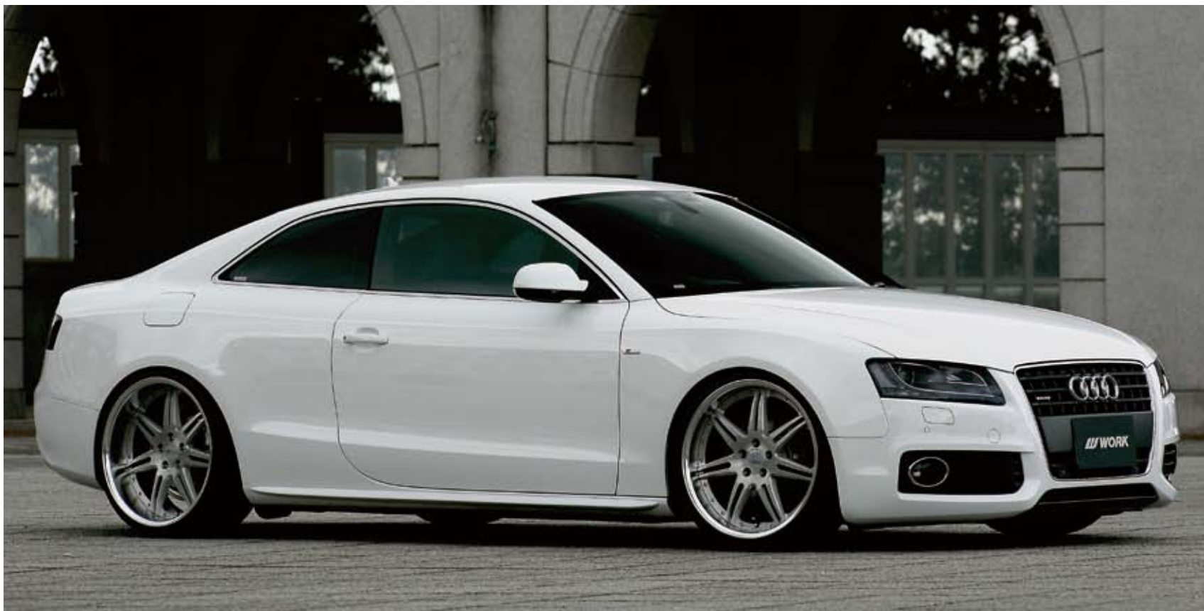
[SIZE] FRONT : 20inch x 9.5J INSET 22mm (R) TIRE : 255/30-20 REAR : 20inch x 10.5J INSET 18mm (O) TIRE : 285/25-20 COLOR : ブラッシュド (BRU) ※フェンダー加工