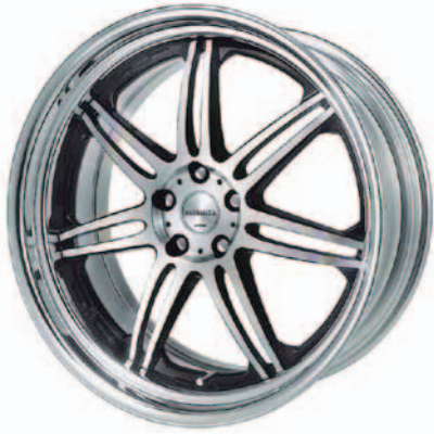
ブラックカットクリア (BP) (STEP RIM) 21

※カスタムオーダープラン対応アイコンの詳細は各ブランドの最終ページをご確認下さい。