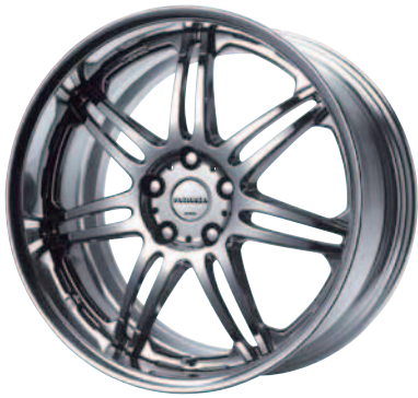
ワークブラックメタルコート (WBC) 19