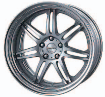
カットクリア (MSP) (STEP RIM) 19