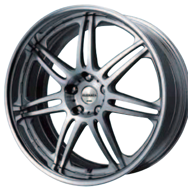
カットクリア (MSP) 20