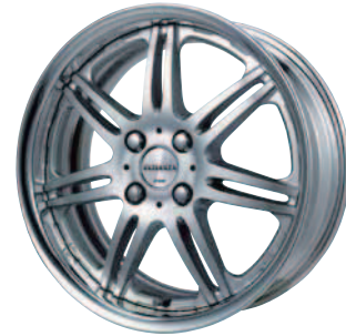
ライトニングシルバー (LS) 16