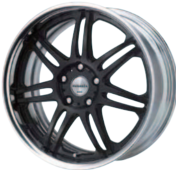
マットディープブラック (MDB) 18