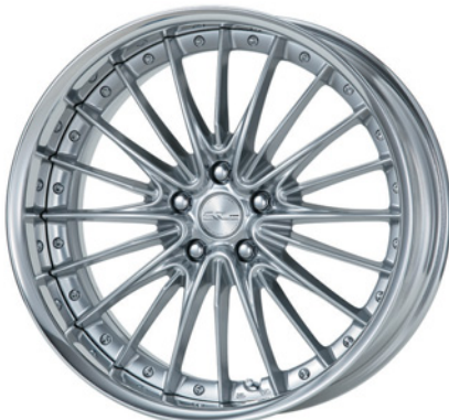
シルキーリッチシルバー