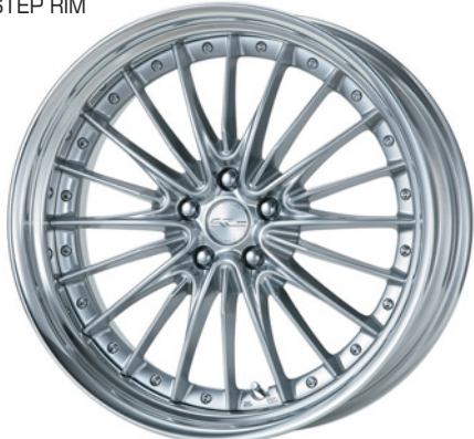
シルキーリッチシルバー