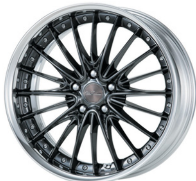
プリリアントシルバーブラック